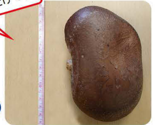
測ってみたら... 約15cm!?!の 大きなしいたけです!