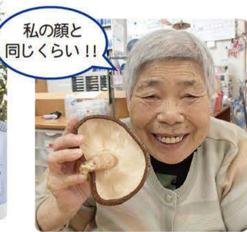
私の顔と 同じくらい!!