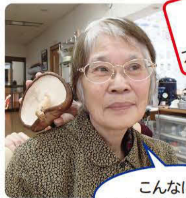
こんなに耳が 大きくなっちゃった!