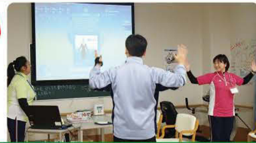
インタラクティブメトロノーム リズムに合わせて手を打ちます。

12月中旬、機能訓練デイサービスフロアにて内覧会を行いました。 多くの関係者の方が訪問してくれました。 静岡県初の「インタラクティブメトロノーム(リズムエクササイズ)」を 中心に、ご案内させていただきました。 今後、多くの利用者様に体験いただけたらと思います。